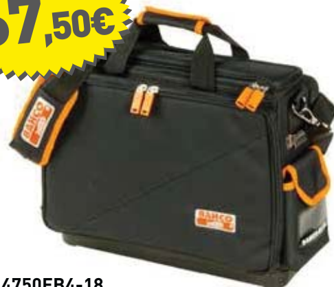
4750FB4-18 Bolsa para PC Portátil Y Herramientas 18" • Secciones laterales desmontables con bolsas para herramientas • Combinación de tejido en poliéster Denier 600 y 1680 • Base de PP rígido para aislar y limpiar con facilidad • Cremalleras de PVC • Bandolera acolchada con ajuste por click • Alojamiento para el flexómetro, tarjetas y teléfono