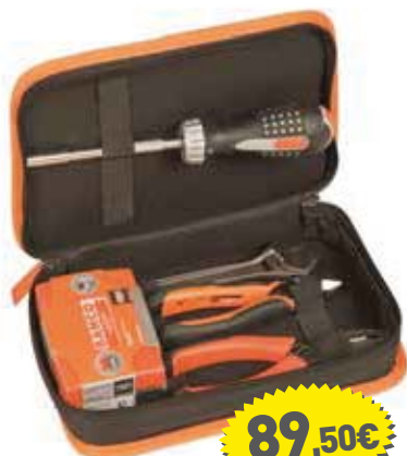
4750FB5ATS001 Estuche con 5 herramientas • Múltiples bandas elásticas en la base para sujeción