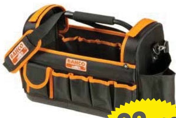
3100TB Bolsa de nylon Herramientas • 600x400x400mm