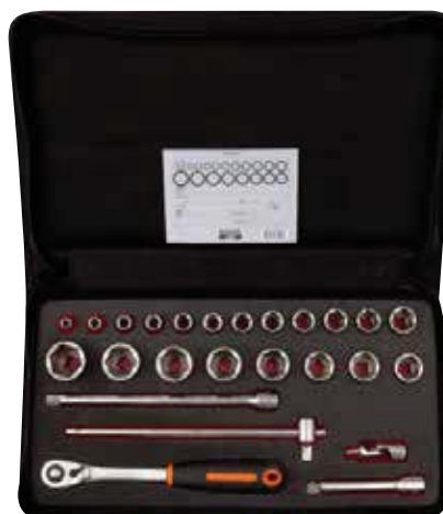
7818SST Juego de vasos 1/2", 18 piezas