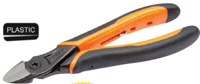
2101PG-160 Alicate de corte diagonal Ergo™