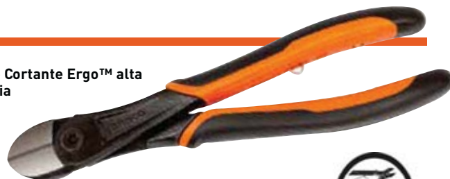
Alicate Cortante Ergo™ alta potencia