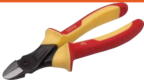
2101 S Alicate corte lateral