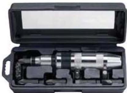
7865 Juego de destornillador a golpe con puntas PH, Rectas y Hex.